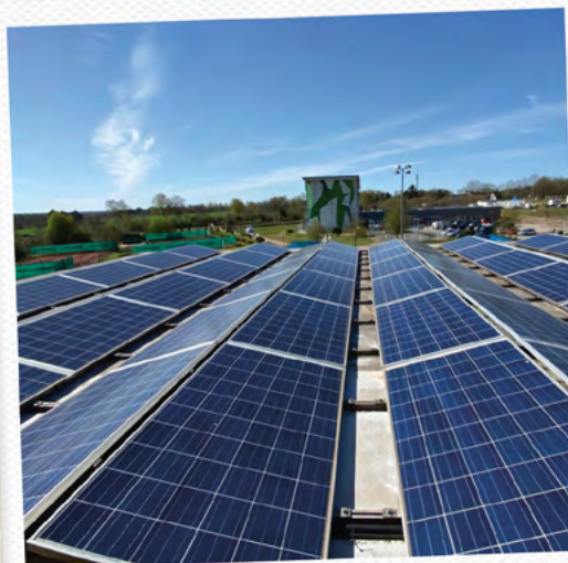
Kletterzentrum Blau-Weiss Buchholz - 33 MWh/Jahr