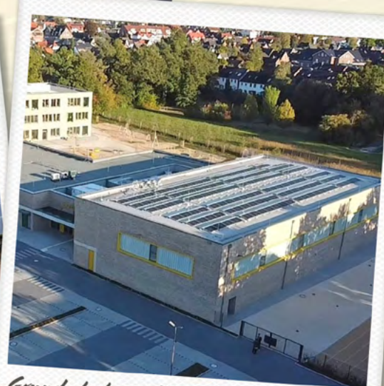
Grundschule am Moor und Veranstaltungszentrum in Neu Wulmstorf – 134 MWh/Jahr