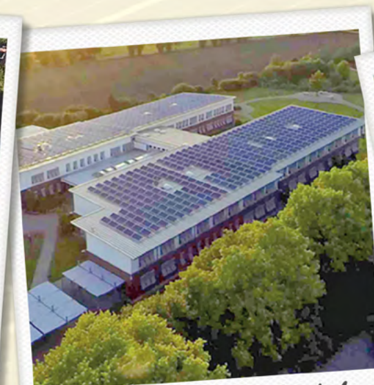
Luhe-Gymnasium in Winsen-Roydorf – 188 MWh/Jahr