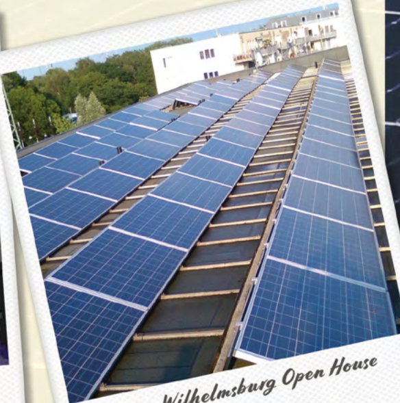
Hamburg-Wilhelmsburg Open House – 62 MWh/Jahr