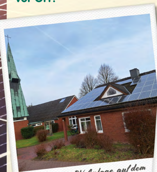
2007: unsere 1. PV-Anlage, auf dem Gemeindehaus der Thomaskirche Klecken – 8 MWh/Jahr

Eigenverbrauch Es ist sinnvoll, den in der PV-Anlage erzeugten Strom direkt vor Ort zu verbrauchen . Diesen rechnet die Genossenschaft zu einem attraktiven Preis mit dem Eigentümer bzw. Nutzer ab. Überschüssiger Strom wird in das öffentliche Netz eingespeist.