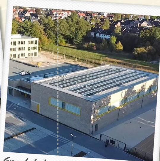
Grundschule am Moor und Veranstaltungszentrum in Neu Wulmstorf – 134 MWh/Jahr