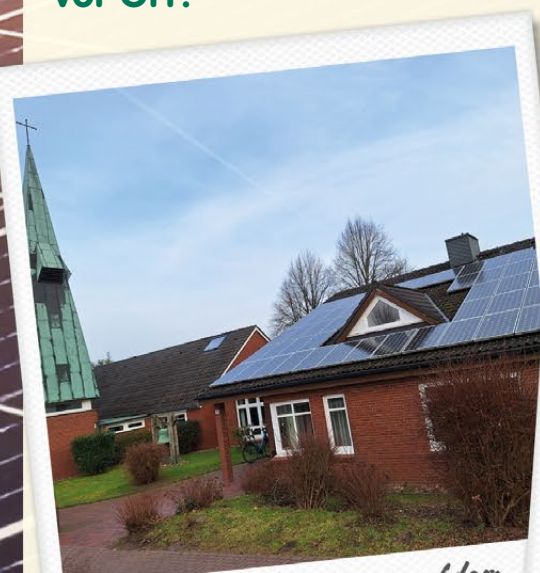
2007: unsere 1. PV-Anlage, auf dem Gemeindehaus der Thomaskirche Klecken – 8 MWh/Jahr

Eigenverbrauch Es ist sinnvoll, den in der PV-Anlage erzeugten Strom direkt vor Ort zu verbrauchen . Diesen rechnet die Genossenschaft zu einem attraktiven Preis mit dem Eigentümer bzw. Nutzer ab. Überschüssiger Strom wird in das öffentliche Netz eingespeist.