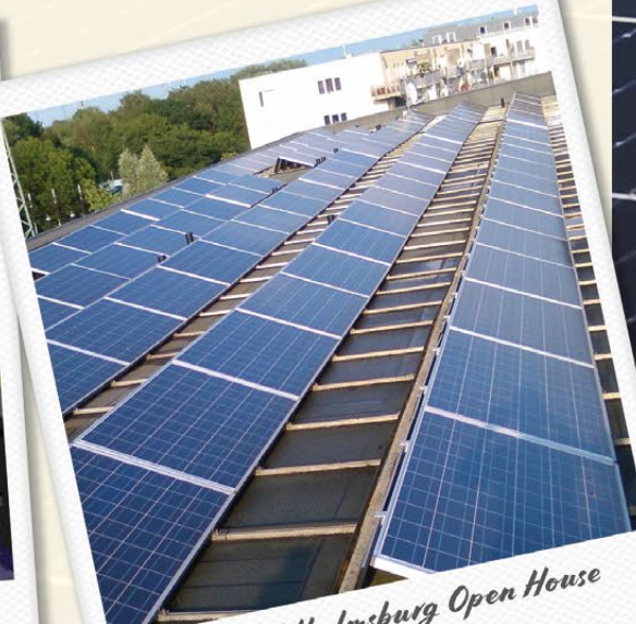
Hamburg-Wilhelmsburg Open House – 62 MWh/Jahr